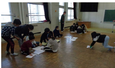
めざせ! そうじのプロ (清掃)