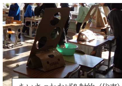
あいさつわなげ&射的 (代表)