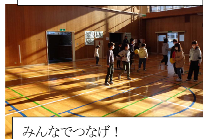
みんなでつなげ! ピンポン玉リレー (スポーツ)