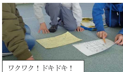
ワクワク! ドキドキ! クロスワード! (保健)