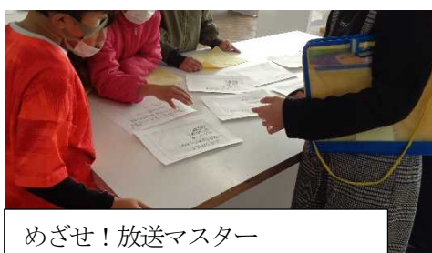
めざせ! 放送マスター 放送委員におれはなる! (放送)