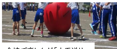
全校で楽しんだ「大玉送り」