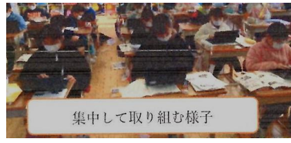
集中して取り組む様子

今後、長期に登校できない場合、各自タブレットを持ち帰ります。学年に合わせて、未来シードで学習したり、Meet等で授業に参加したりする予定です。（内容等については担任より連絡いたします）。