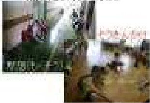
清掃(せいそう)のようす

◆これは清掃の時の写真です。学校中がシーンとなる黙想の時間は、全校の心が1つになる瞬間でとてもステキです。ひざをついて一生懸命雑巾がけする姿もすごいです。これは中込小学校の自慢できる良いところです。