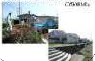
PTA作業・・・5年生の保護者の皆さんが学校をきれいにしてくださっています。

◆これは、PTA作業の様子です。毎年この時期5年生の保護者の方が、全校の皆さんのために学校をきれいにしてくださっています。土曜日の朝早く来てくださり、普段のお掃除ではなかなかできないところを、きれいにしてくださりました。ありがとうございました。5年生の皆さん、お家の方によろしくお伝えください。